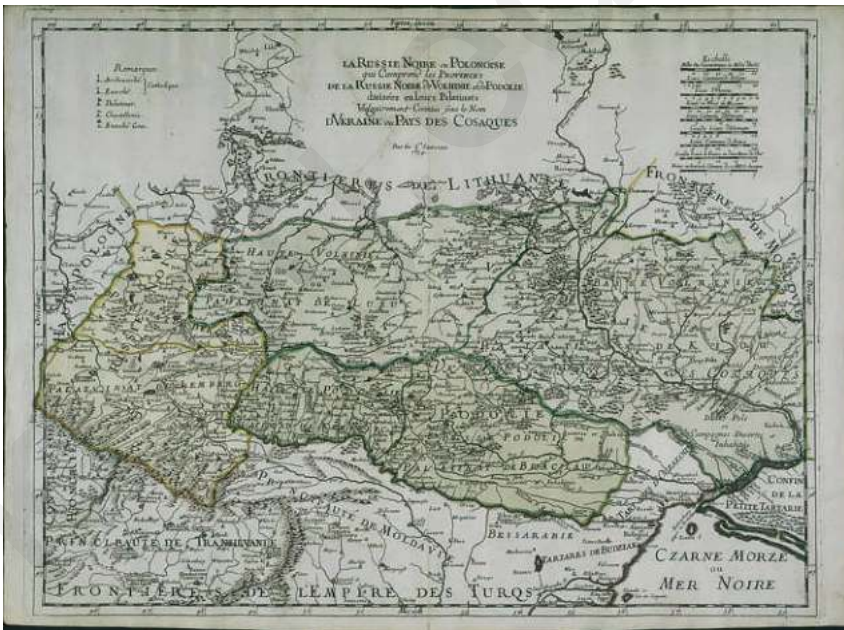
Рис. 2. «Ukraine ou Pays des Cosaques» («Укр їн — держ в коз кїв») Гійом С нсон ,1674 р. Н сході — Frontieres de Moscovie («Межі Московії»)

Особливості характеру московського народу впадали в очі багатьом європейським та арабським мандрівникам, які у різні часи перебували на цих теренах. Один з них, австрійський дипломат Сигізмунд Герберштайн, який відвідав Московію у 1517 та 1526 рр., виклав свої враження у книжці «Записки про Московію», надрукованій у Відні 1549 р. З ретельністю дипломата він максимально об'єктивно подав факти і спостереження про країну, де випало працювати. Наведемо деякі, оприлюднені філософом Петром Кралюком.